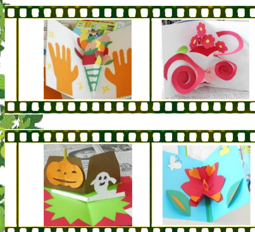
講習で皆さんが作ったカード

さいたまファミリー・サポート・センターは、誰もが安心して子育てができるように、育児の援助を行いたい人(提供会員)と育児の援助を受けたい人(依頼会員)が会員となり、会員相互による育児の援助活動を行っています。