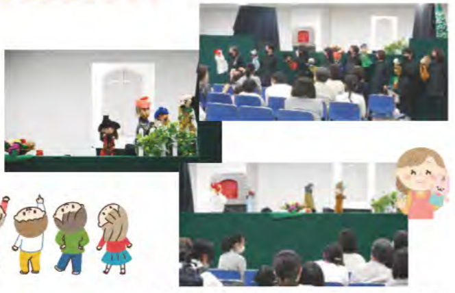
人形劇サークル「大きなカブ」のみなさん

コロナ感染に気をつけながらの観劇会となりました。観客側も大きな声を出すことはできませんが、みんな目をキラキラさせて劇を楽しんでいました。