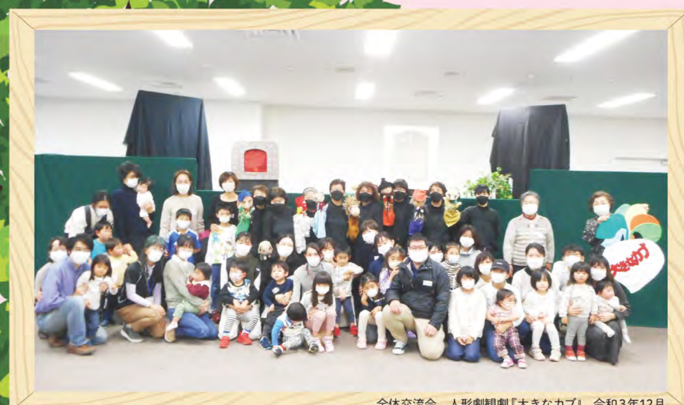
全体交流会 人形劇観劇『大きなカブ』 令和3年12月

さいたまファミリー・サポート・センターは 誰もが安心して子育てができるように、 育児の援助を行いたい人(提供会員)と 育児の援助を受けたい人(依頼会員)が会員となり、 会員相互による育児の援助活動を行っています。